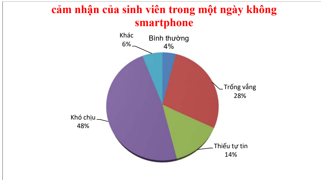
Biểu đồ 2.3: Cảm nhận của sinh viên khi trong một ngày không có smartphone

Qua số liệu ở biểu đồ trên, cảm nhận của sinh viên nếu một ngày không có smartphone là họ sẽ cảm thấy khó chịu chiếm 48%, một con số khá cao trong tổng số 50 người khảo sát, cảm thấy trống vắng chiếm 28%, cảm thấy thiếu tự tin chiếm 14%, số sinh viên cảm thấy bình thường nếu một ngày không có smartphone chiếm 6% và cuối cùng là cảm nhận khác chiếm 4%. Từ những số liệu trên, có thể thấy được mức độ sử dụng smartphone của các bạn sinh viên là rất thường xuyên, các bạn đều có những cảm giác tiêu cực, gần như không thể thiếu nó được. Smartphone đã trở thành vật bất ly thân đối với các bạn sinh viên, nó đã là một phần trong cuộc sống của các bạn. Việc sử dụng smartphone gần như là việc ăn uống hằng ngày của các bạn, không thể bỏ sót hay thiếu vắng một ngày nào cả. Nếu một ngày nhịn ăn các bạn sẽ cảm thấy bụng mình đói, cũng như một ngày không sử dụng smartphone các bạn sẽ cảm thấy khó chịu, cảm giác trống vắng, rất khó tả, nói chung rất khó để sống mà không có smartphone bên